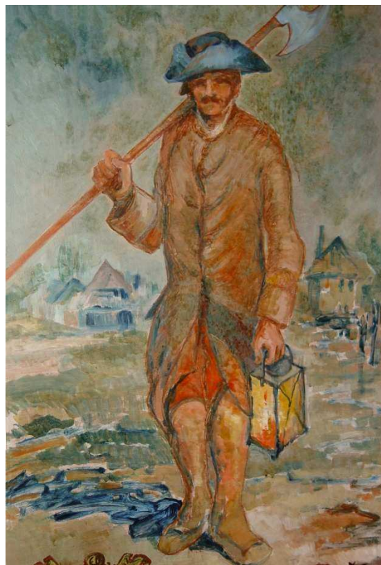
Nočni stražar — zaščitni znak Gasilskega muzeja dr. Branka Božiča v Metliki