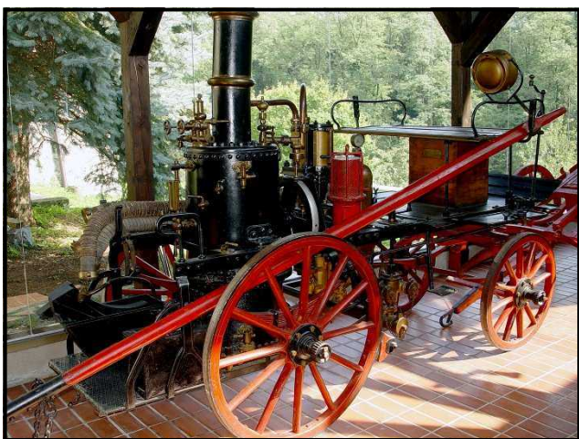
Brizgalni na ročni pogon — muzejska eksponata