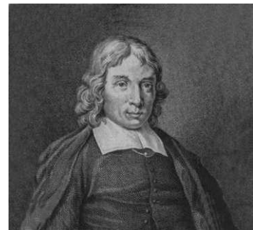
JAN van der HEYDEN

JAN van der HEYDEN , bil je nizozemski baročni slikar, skircirk, tiskar in izumitelj, ki je pripomogel k sodobnemu gasilstvu. Leta 1672 je izboljšal tedaj že uporabno brizgalno, izpopolnil priročnik gasilske opreme, leta 1685 organiziral prvo evropsko prostovoljno gasilsko brigado, napisal ter s slikami opremil prvi gasilski priročnik ter vpeljal sesalne in tlačne cevi.