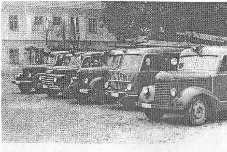
Vozila v gasilski šoli v Medvodah

Slovensko gasilstvo je tako dobilo svojo prvo gasilsko šolo, za katero je zamisel tlela že od leta 1937.