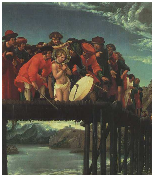
Mučenje sv. Florjana

Kristjane so preganjali v času vladanja cesarjev Dioklecijana in Maximusa. Okrutni cesar je ujel štirideset kristjanov in jih po dolgem mučenju vrgel v temnico. Ko je za to slišal Florjan, ki je bil v tem času upokojeni glavni častnik v mestu Cetiumu (danes Zeiselmaur), je pohitel v Lorch in sam priznal, da je kristjan. V svojem prepričanju so ga mučili in se na koncu odločili, da ga z mlinskim kamnom okrog vratu z mostu vržejo v reko Enns.