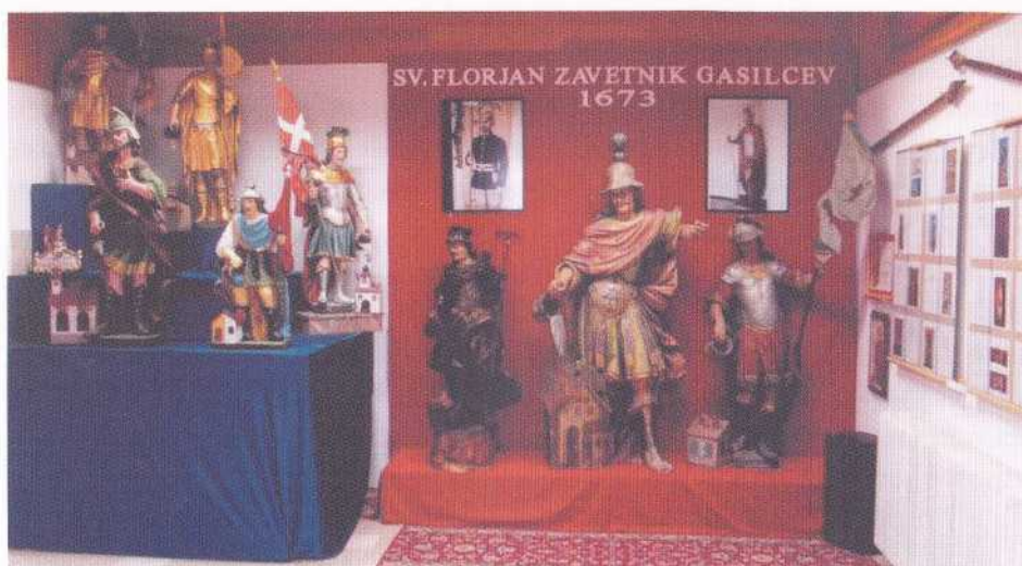
Gasilska razstava Dotik s časom – 1700 let od smrti sv. Florjana (304 - 2004)

Z osamosvojitvijo naše države se sveti Florjan vrača v gasilske domove in na nove gasilske prapore.